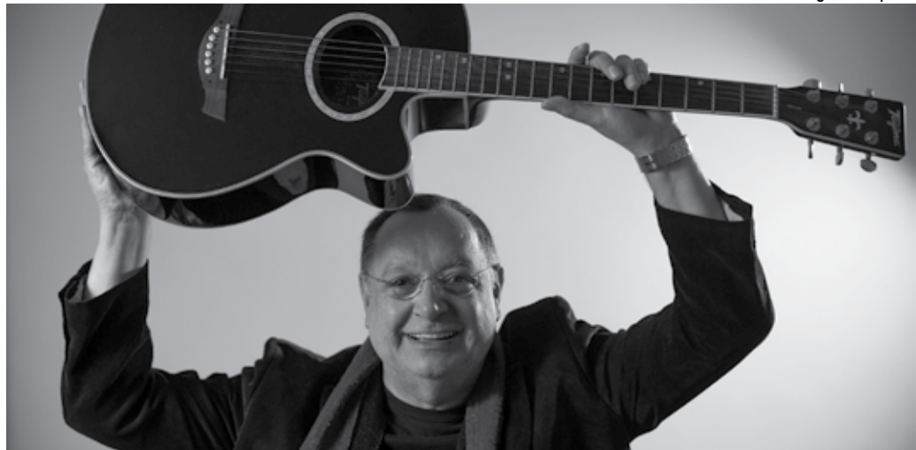
Franco passou por períodos de ostracismo, assim como grandes gênios da MPB, mas nunca deixou de trabalhar