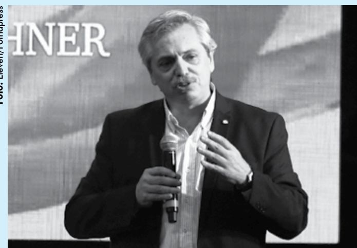
Fernández é o favorito para ganhar o pleito em 1º turno na Argentina

No Uruguai, as pesquisas apontam para um segundo turno. Para vencer em primeiro turno, o candidato tem que receber 50% dos votos mais um. O candidato com mais intenções de voto é Daniel Martínez, com cerca de 33%. Martínez é do partido de esquerda Frente Amplio, há 15 anos no poder. Em segundo lugar nas pesquisas aparece Luis Lacalle Pou, do Partido Nacional, de direita, com 25% das intenções de voto.