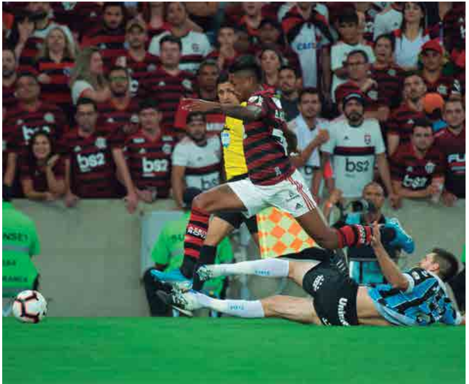
O Flamengo se impôs com um melhor futebol diante do Grêmio nos dois confrontos da Taça Libertadores e na soma das partidas levou a melhor por 6 a 1

Flamengo ganhou R$ 12 milhões na primeira fase e mais R$ 18 milhões nas oitavas, quartas e semifinais. Se for campeão, leva mais R$ 48 milhões