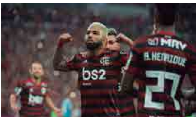
Gabigol fez dois gols e assumiu a artilharia da Taça Libertadores