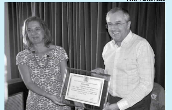
O jornalista e escritor Laurentino Gomes se torna sócio honorário do IHGP