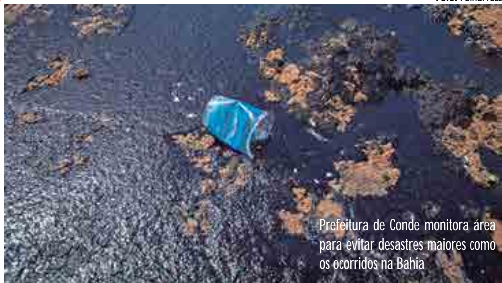
Prefeitura de Conde monitora área para evitar desastres maiores como os ocorridos na Bahia